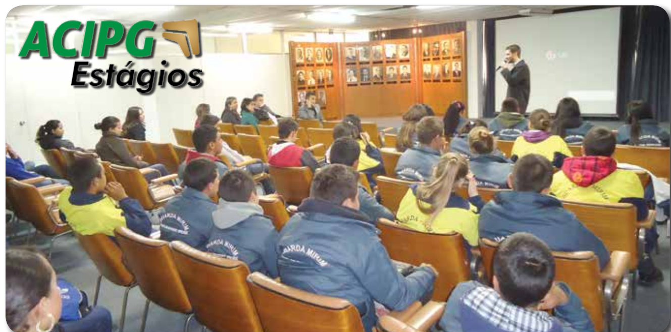
O assessor para assuntos de Políticas Públicas para a Juventude do governo do Estado, Henrique do Vale, palestrou para o ACIPG Estágios

Mais informações sobre o programa ACIPG Estágios através do site www.acipg.org.br .