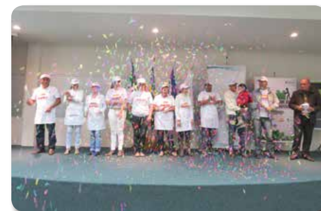
Nucleados do Napes festejam suas ações e conquistas

Entre as conquistas destacam-se respeito por parte das autoridades de fiscalização sanitária, padronização de procedimentos, curso de manipulação e higienização de alimentos para todos os nucleados, compra conjunta de produtos e uniformes e credibilidade do grupo na participação em grandes eventos e feiras, como Easy Road e Feira de Malhas de Imbituva.