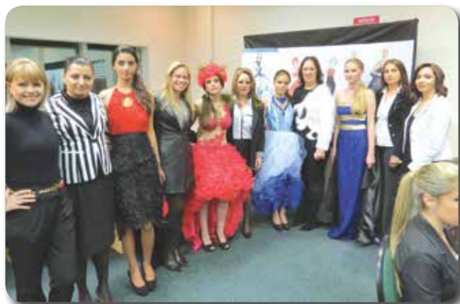
Durante a apresentação no 1º Simpósio do Empreender da ACIPG, o NSE realizou desfile de moda

Lançado em 2011, o Prêmio é uma homenagem à estilista e designer de moda. Dilma Ozório é a pioneira e ícone de moda em Ponta Grossa, que com trabalho profissional trouxe novas tendências para a cidade.