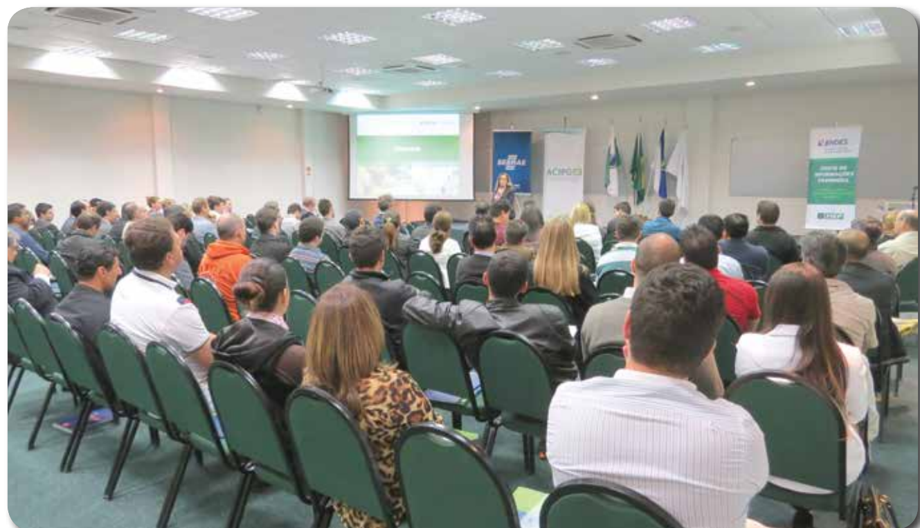
O Seminário de crédito aconteceu na ACIPG, dia 1º de outubro

Linhas de crédito diferenciadas e rodadas de negócios são apresentadas aos empresários