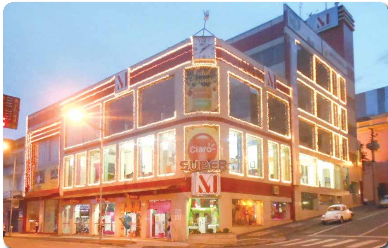
Em 2012, Super MM ficou em 1º lugar na categoria Comércio

sentantes de segmentos que trabalham para um objetivo comum, resgatar o centro do Natal: Jesus. Convidamos nossos associados e empresários da cidade para que participem do projeto".