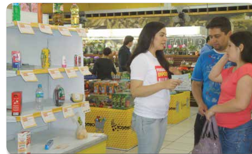
Através do Feirão do imposto, população sabe o quanto de imposto paga em cada produto

"Áreas como saúde e educação são precárias e sabemos que se o dinheiro pago em impostos fosse bem utilizado poderíamos ter melhores condições de atendimento básico. Acho a ação importante, pois é uma maneira da