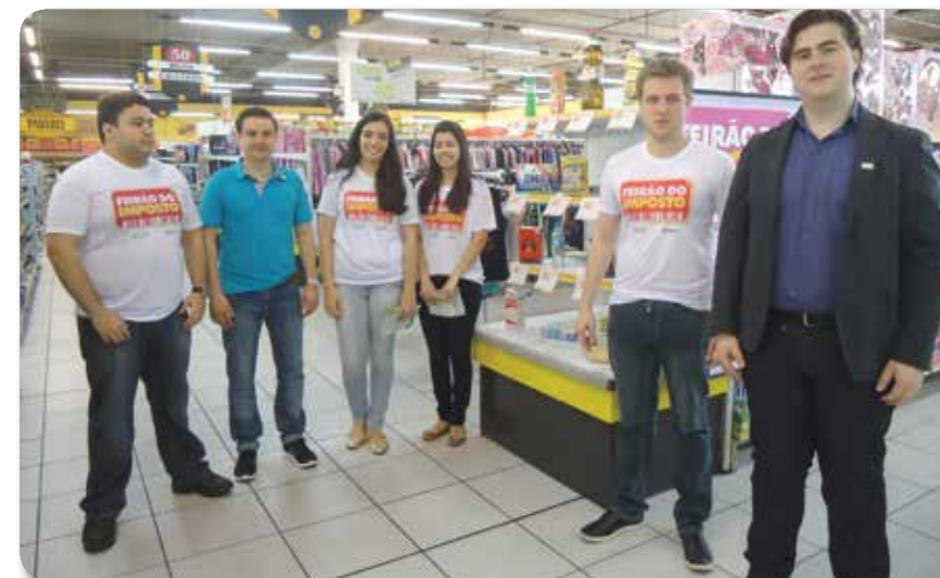
Alguns dos conselheiros do Conjove no Feirão do Imposto realizado no Tozetto do Jardim Carvalho

O Feirão do Imposto foi desenvolvido em parceria com a Associação Comercial, Industrial e Empresarial de Ponta Grossa (ACIPG). Informações: www.feiraodoimposto.com.br .