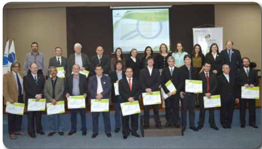
Membros do Conselho Consultivo do Observatório Social dos Campos Gerais

“O Conselho Consultivo auxiliará o Observatório